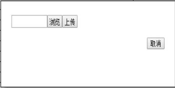
图 3.6-1 导入 EXCEL 文件的部门信息

3、点击【浏览】按钮，弹出路径选择窗口，选择符合部门信息导入模板要求的 EXCEL 文件的路径，如图 3.6-2：