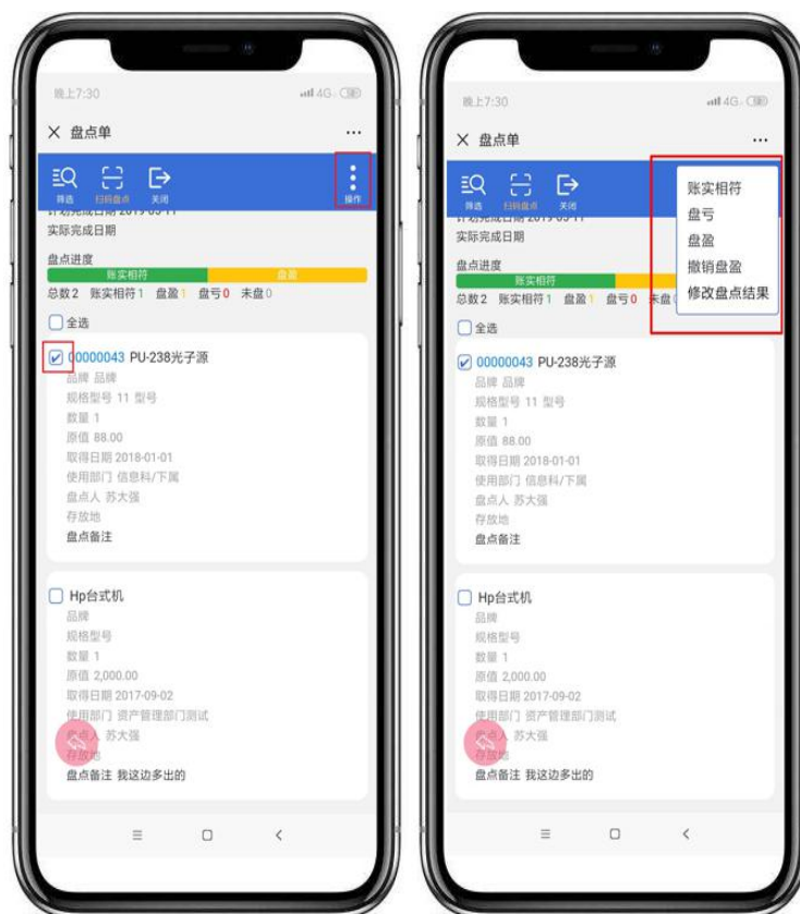
图 7.2-2 手工盘点

盘点到盘盈的资产（即有物无账），点击【操作列】按钮点击盘盈按钮，在弹窗中输入盘盈的资产信息，并填写盘点备注，说明情况。